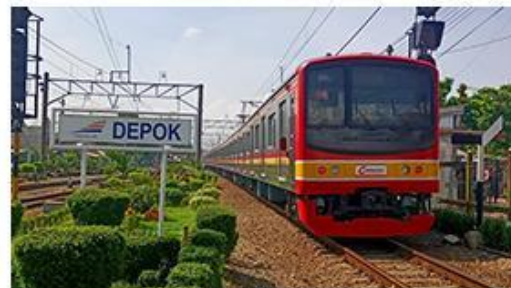
25 Menit ke Stasiun Depok Lama