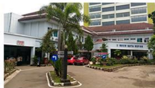
10 Menit ke RSUD Kota Depok