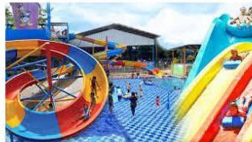
15 Menit ke Taman Wisata Pasir Putih