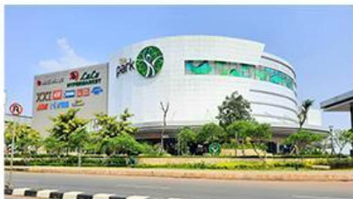
10 Menit ke DPark Mall Sawangan