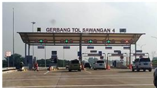
15 Menit ke Gerbang Tol Sawangan