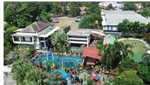
15 Menit ke Taman Rekreasi Pondok Zidane