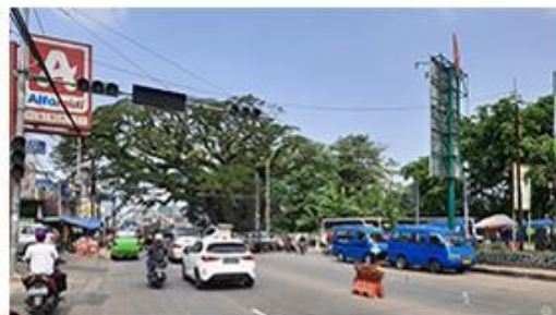
10 Menit ke Pasar Parung