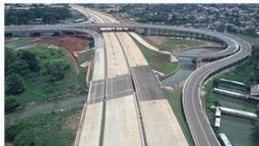
15 Menit ke Gerbang Tol Cinere - Serpong